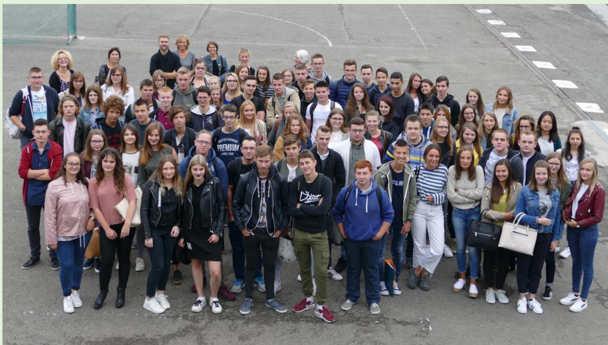
Nos futurs diplômés.

Notre pédagogie s'efforce d'être orientée sur la construction progressive du projet d'insertion du jeune dans la vie étudiante, sociale et professionnelle.